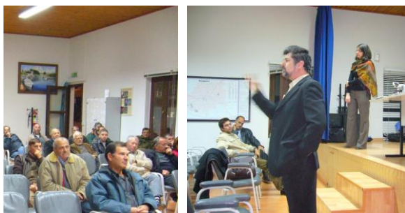
Πρώτο Σεμινάριο για Γεωργούς σχετικά με το Πιλοτικό Πρόγραμμα στην Ξυλοφάγου στις 28 Νοεμβρίου 2011

Η Ξυλοφάγου, έχει επιλεγεί ως η κοινότητα που θα συμμετάσχει στην πιλοτική εφαρμογή του συστήματος συλλογής πλαστικών συσκευασίας αγροχημικών. Στη συνάντηση οι συμμετέχοντες είχαν την ευκαιρία να ενημερωθούν για το σκοπό και τις εργασίες του AGROCHERPACK, τη χρησιμότητα και τα περιβαλλοντικά οφέλη της εφαρμογής του, τον τρόπο εφαρμογής του και τα συμβαλλόμενα μέρη.