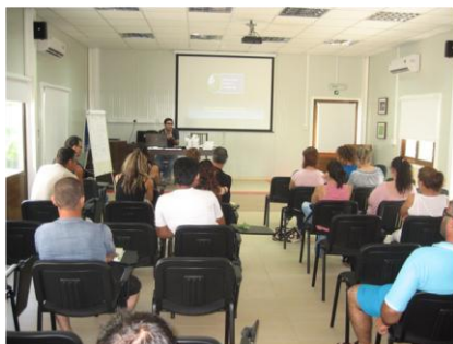
Φωτογραφικό στιγμιότυπο από την εκπαίδευση γεωπόνων του Τμήματος Γεωργίας

Στις 14 Νοεμβρίου του 2011, άρχισε ο δεύτερος κύκλος εκπαίδευσης στο Κέντρο Εκπαίδευσης Υδροπονίας στο Ζύγι σε Λειτουργούς του Τμήματος Γεωργίας με σκοπό την απόκτηση ειδικών δεξιοτήτων στη διαχείριση και λειτουργία των υδροπονικών συστημάτων.