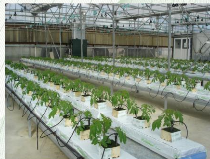
Υδροπονική καλλιέργεια ντομάτας

Το πρόγραμμα εκπαίδευσης συνεχίστηκε με την κάθοδο του Καθηγητή Δημήτρη Σάββα σε θέματα υδροπονικών καλλιεργειών από το Γεωπονικό Πανεπιστήμιο Αθηνών. Το πρόγραμμα συνεχίζεται σε 15ήμερη βάση, υπό την καθοδήγηση του Ανώτερου Λειτουργού Γεωργικών Ερευνών, Δρ. Δαμιανού Νεοκλέους , και αναμένεται να ολοκληρωθεί το Μάιο του 2012.